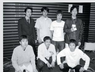
【写真:IVRC 2002 コンテスト期間中の様子】