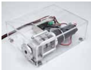
アクチュエータユニット