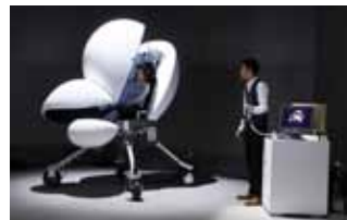
メディアピークル

デバイスアートは、人と作品が相互作用する装置そのものが表現内容になります。デバイスアート・ツールキットは、このような作品の制作における試行錯誤をやりやすくするための道具です。