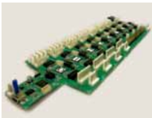
多数の制御基板を連結したところ

Volflex+は、デバイスアート・ツールキットを使った作品例です。これは体積が制御できる空気圧バルーンを、直動アクチュエータの先につけることによって、様々な形の立体を表現するデバイスです。これには20個のアクチュエータが使われていますが、多数の制御基板を背骨のようにつなぎ合わせることによって、それらを円滑に制御できます。また、ロボットタイルとメディアピークルのような大型の作品には、人を載せて運んだり、持ち上げたりする強力なモーターが搭載されていますが、これらもデバイスアート・ツールキットによって制御されています。