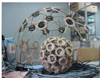
Wind Stage 金沢工業高等専門学校 明治大学

多重構造、無限性、自己相似、以上の三つの原理を基にデザインされた新しい可能性を秘めた実世界造形。