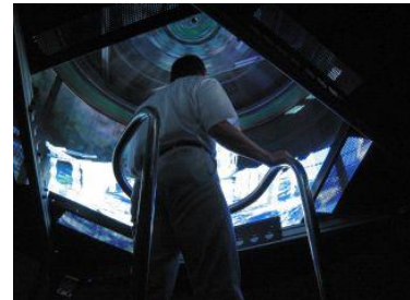
TWISTER V 東京大学

「腕の上を何かが這っているよ、お母さん！あ、洋服の中に入ってきちゃうよー」ぞくぞくさわさわ。気持ち悪い？でもなんだかおもしろい？