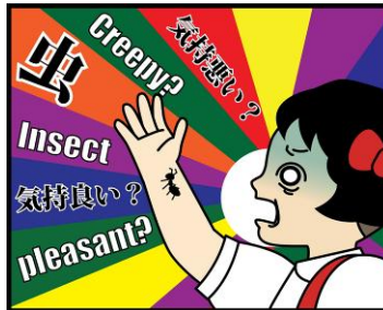
虫 HOW? 電気通信大学

人の知覚特性に基づいた力覚レンダリングにより、従来は不可能であった物体や材質もバーチャルに再現。