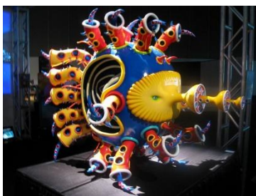
Infinite 4D Fish 東京大学

没入立体映像提示を実現する装置。特殊なメガネなどを付けることを必要とせずに、全周囲の立体映像を提示することができる。