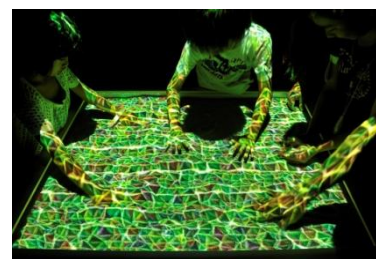
硬軟ディスプレイ 「マグネットスフィヤー」 首都大学東京 日本電子専門学校

複数方向の風の情報記録と呈示を行えるシステム。風のアーカイブ化により過去の風や遠隔地の風を再現。